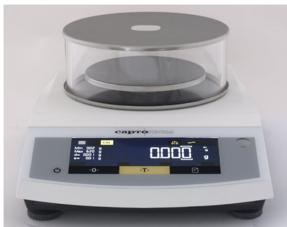
Рисунок 2 Общий вид весов с d = 1,0 мг CE153-C+; CE323-C+; CE423-C+; CE623-C+