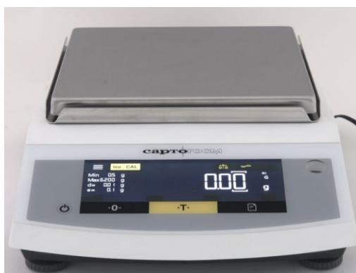
Рисунок 3 Общий вид весов с d = 10 мг и 100 мг CE622-C+; CE822-C+; CE1502-C+; CE2202-C+; CE4202-C+; CE6202-C+; CE6201-C+; CE8201-C+