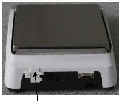
Рисунок 4 – Место пломбирования весов от несанкционированного доступа

Для защиты весов от несанкционированной настройки и вмешательства, которые могут привести к искажению результатов измерений, весы пломбируются контрольной этикеткой изготовителя. Место пломбирования обозначено на рисунке 4. Место нанесения знака поверки обозначено на рисунке 5.