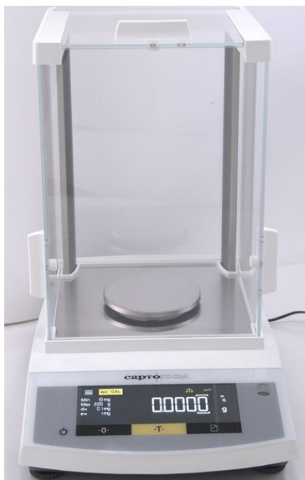
Рисунок 1 Общий вид весов с d = 0,1 мг CE124-C+; CE224-C+