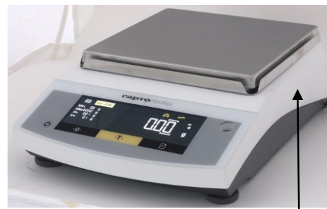
Рисунок 5 – Место нанесения знака поверки

Маркировочная табличка в виде наклейки (рисунок 6), расположена на боковой стенке корпуса весов.